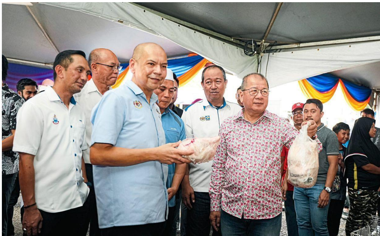
with pix: Acting Domestic Trade and Cost of Living Minister Datuk Armizan Mohd Ali (third from left) checking out the prices of chicken during the launch of the Rahmah Sales Programme in Sabah's Beaufort district on Sunday (Nov 5).

KOTA KINABALU: The Rahmah sales programme in Sabah, Sarawak and Labuan will be stepped up by the Domestic Trade and Cost of Living Ministry to ensure people get reasonable prices for chicken, says its acting minister Datuk Armizan Mohd Ali.