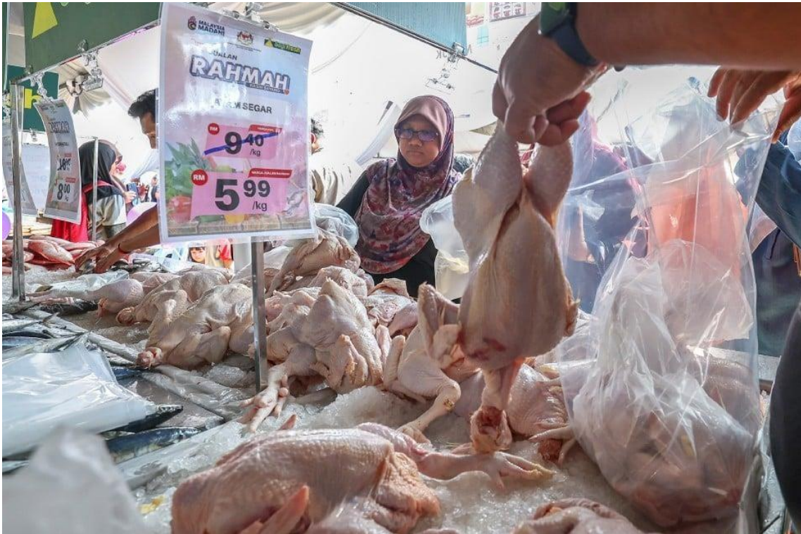
Pengunjung sambutan November Bulan Keluarga Kebangsaan bertemakan 'Keluarga Harmoni, Negara Madani' tidak melepaskan peluang membeli ayam segar dengan harga RAHMAH di Dataran Putrajaya hari ini.

LANGKAWI: Harga ayam bulat segar di seluruh negara dilaporkan stabil tanpa kenaikan mendadak selepas penamatan sepenuhnya pemberian subsidi dan harga kawalan bagi bahan mentah itu sejak Rabu lalu.