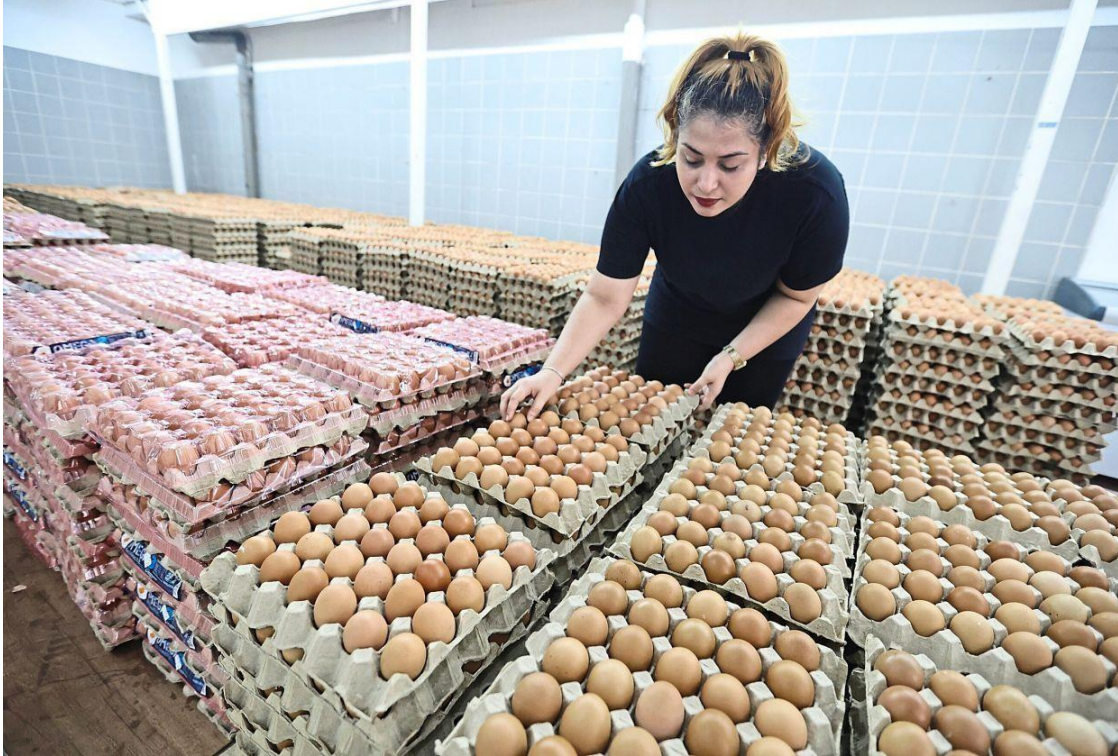
More time needed: Distributors say most farms have less than a day's stock.

PETALING JAYA: Malaysia's egg industry is struggling to establish healthy buffer levels as buyers are snapping up whatever eggs the layer farms are producing, say industry players.