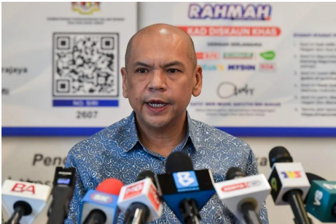
Pemangku Menteri Perdagangan Menteri Dalam Negeri dan Kos Sara Hidup, Datuk Armizan Mohd Ali.

BEAUFORT: Kementerian Perdagangan Dalam Negeri dan Kos Sara Hidup (KPDN) melipatganda dan memperkasakan pemantauan untuk memastikan bekalan ayam mencukupi serta dijual dengan harga berpatutan khususnya di Sabah, Sarawak dan Labuan.