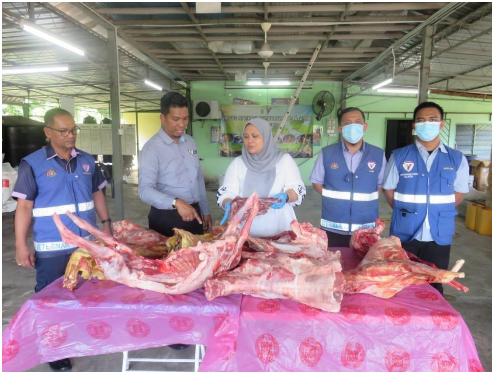
Pegawai Veterinar JPVPP sedang melakukan pemeriksaan kesihatan pada karkas kambing yang dirampas di sebuah premis ternakan di Bukit Mertajam, pagi tadi.

SEBERANG PERAI – Jabatan Perkhidmatan Veterinar Pulau Pinang (JPVPP) merampas 76.1 kilogram (kg) karkas kambing sejuk beku dipercayai untuk jualan tempahan sempena perayaan Deepavali di sebuah premis ternakan di Bukit Minyak, Bukit Mertajam di sini, pagi tadi.