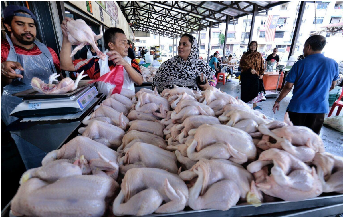
PENIAGA-peniaga ayam segar di Pasar Ampangan, Seremban melayan permintaan pembeli ketika tinjauan di pasar berkenaan baru-baru ini.-UTUSAN/MOHD. SHAHJEHAN MAAMIN.

PETALING JAYA: Harga makanan ternakan yang terdiri daripada kacang soya dan jagung akan menjadi faktor utama yang menentukan harga ayam di pasaran tempatan.